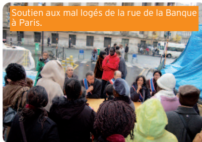
Soutien aux mal logés de la rue de la Banque à Paris.

➤ Plus 3 millions d'€ pour l'hébergement d'urgence