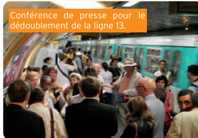
Conférence de presse pour le dédoublement de la ligne 13.

➤ Transports : la Région sur tous les fronts