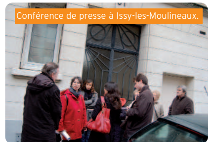
Conférence de presse à Issy-les-Moulineaux.

➤ La vente de logements sociaux HLM (92) est une provocation