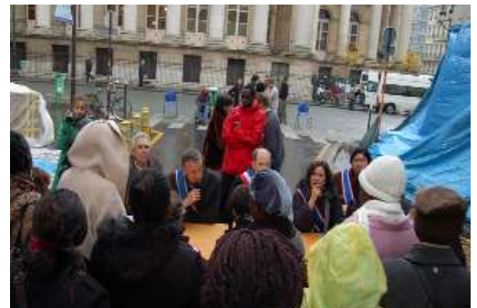
Soutien, des élu-e-s de gauche, en octobre 2007, aux 370 familles franciliennes qui survivent sur le trottoir de la Rue de la banque, dans le 2 ème arrondissement de Paris.

Nous sommes arrivés à des objectifs clairs de solutions à apporter à la crise, qui sont à mon sens très largement partagés à gauche, et parfois même au-delà. De leur côté les mouvements sociaux se fédèrent et se rassemblent, et prennent leur responsabilité pour affronter la crise du logement. Cette convergence sur les objectifs, sur les solutions et sur les luttes doit maintenant déboucher, avec des rassemblements très larges.