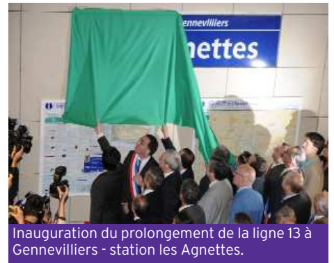
Inauguration du prolongement de la ligne 13 à Gennevilliers - station les Agnettes.

Enfin, le STIF s'engage résolument dans une grande politique d'investissements : 350 millions d'€ pour l'amélioration de l'accès aux gares, plus d'achats de matériel roulant, et le financement de portes palières pour protéger les quais de 12 stations de la ligne 13. Un pas important