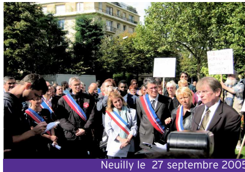
Neuilly le 27 septembre 2005

Neuilly-sur-Seine pour dénoncer ces maires qui pratiquent la ghettoïsation sociale de fait. Cette action s'est poursuivie. En octobre dernier des élus communistes et alternative citoyenne de Seine Saint-Denis, des Hauts-de-Seine, du Groupe CACR et environ 200 personnes se sont de nouveau rassemblées à Neuilly. Lors des deuxièmes Etats